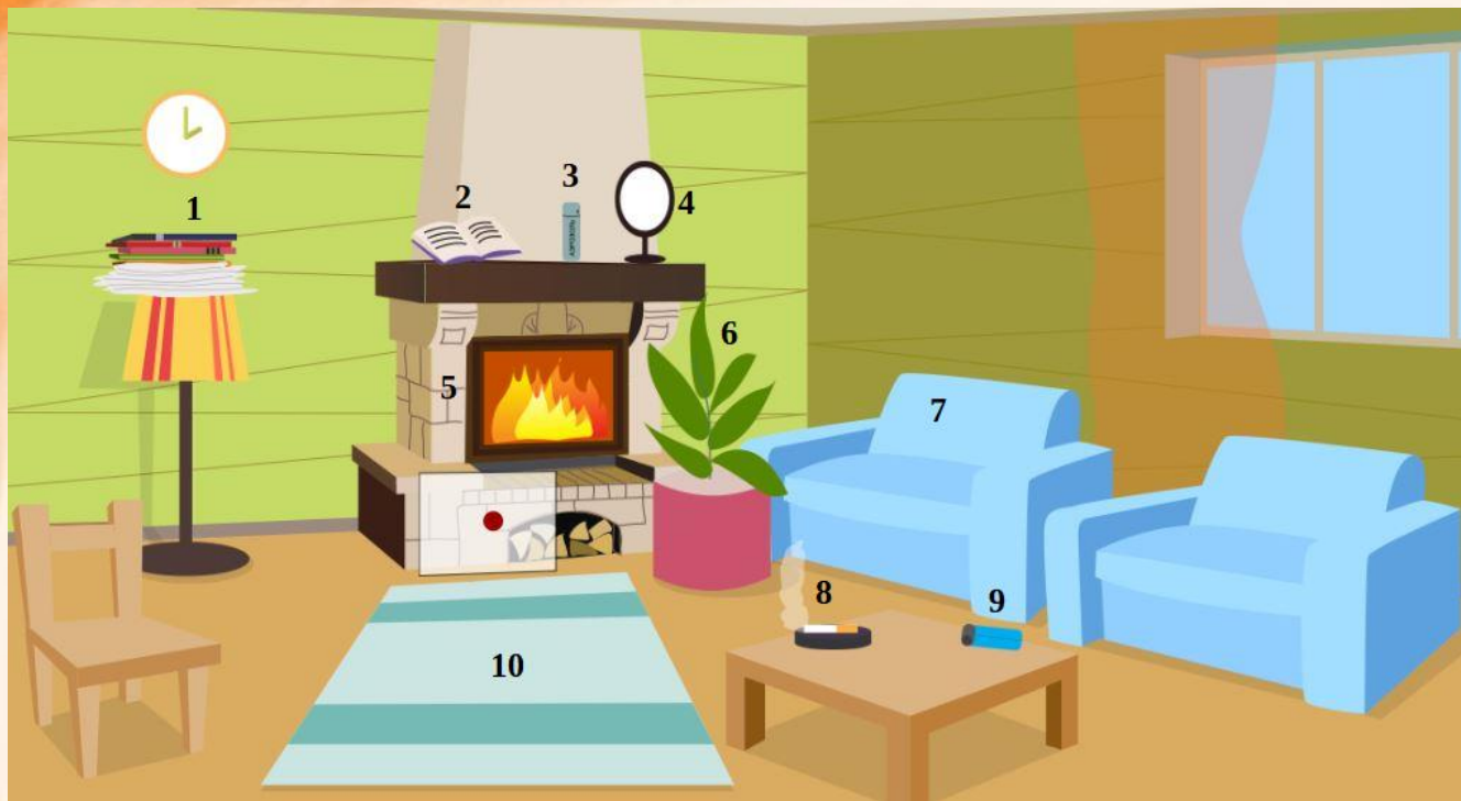
Рис. 4 Проверь найденные нарушения пожарной безопасности в гостиной