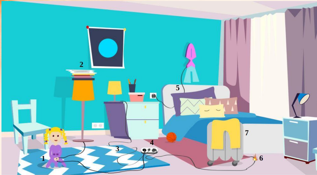
Рис. 5 Проверь найденные нарушения пожарной безопасности в детской