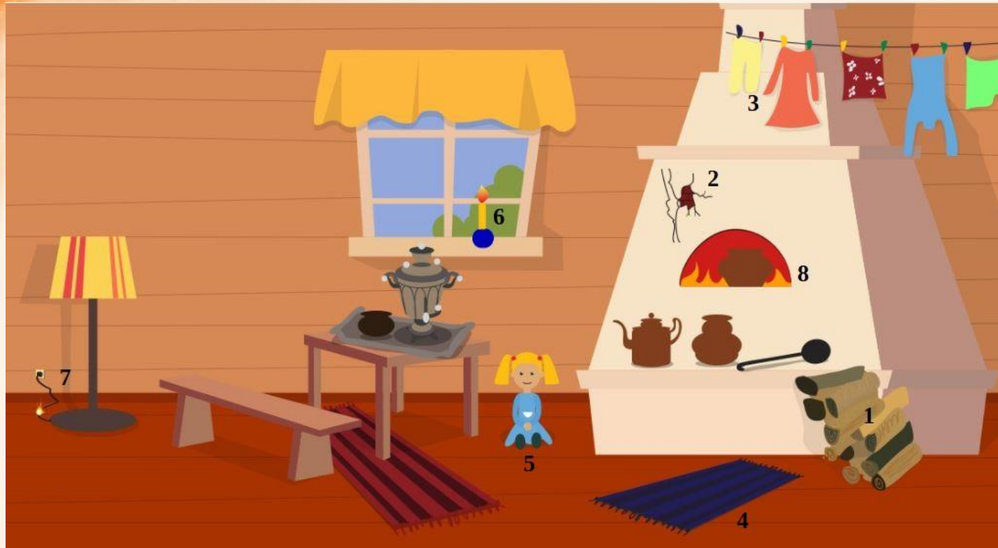
Рис. 1 Проверь найденные нарушения пожарной безопасности в доме