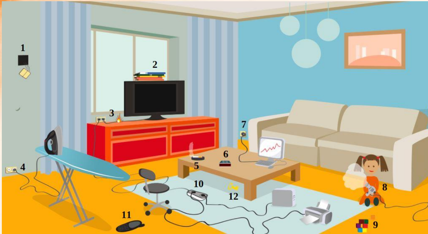
Рис. 3 Проверь найденные нарушения пожарной безопасности в гостиной